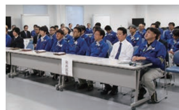
年に1度全員参加の安全活動（「CA1 (Chemway Anzen No.1)」）を開催し安全文化の醸成と自主保安活動の促進に努めております。

丸善石油化学の安全に関わる全ての活動を「安全ナンバーワン活動」とし、千葉工場、四日市工場をはじめ、全社で安全管理の一体的な推進を図っています。