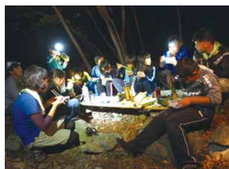
「コスモわくわく探検隊」キャンプの様子

1993年から車社会への貢献として交通遺児の小学生を対象に、環境の大切さを考える機会の一助となることをめざして、自然体験プログラム「コスモわくわく探検隊」を実施しています。コスモ石油では、これからもさまざまな社会貢献活動を推進していきます。