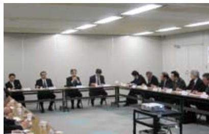
総合安全対策本部会議

安全管理活動の実績報告・評価や安全査察の結果報告等は、原則年1回開催している総合安全対策本部会議で報告するとともに、経営執行会議へ上程し、その資料は全社員に公開されています。