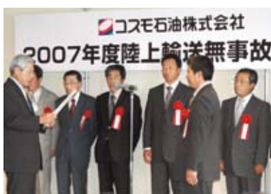
陸上輸送無事故表彰式

2008年度はさらに多くの運送会社に表彰式に参加していただけるよう、協力運送会社とともにより強固な安全体制を構築していきます。