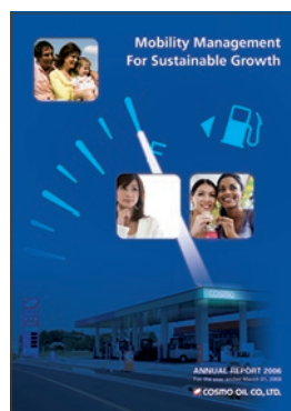
アニュアルレポート

アニュアルレポート(年1回)や株主通信(年4回)を定期的に発行するほか、ホームページを充実させています。ホームページでは決算説明会の模様を動画で配信するとともに、配布資料もすべて掲載しています。特に個人投資家様向けのサイトの充実など、幅広い層の投資家の皆様に理解を深めていただくことをめざしています。こうした取り組みによって、IR支援会社など外部機関が実施するIRサイト調査においても、継続的に高い評価をいただいています。また、株主通信「C's MAIL」では毎年株主アンケートを実施し、株主の皆様のご意見を経営陣にフィードバックし経営施策や誌面づくりにも反映させています。