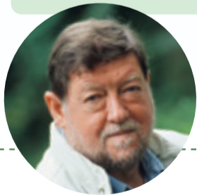
理事長 C.W. ニコル氏

自然の中の遊びは、仲間と会話をし、協力をするというコミュニケーションの上に成り立っています。そして、五感を使うことで豊かな感性と想像力、元気な心を育むことができます。最初は簡単な事でも構わない。とにかく自然を“経験”してほしい。