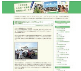
コスモ石油エコカード基金事務局レポート http://cosmooil.info/