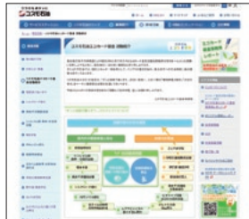
コスモ石油エコカード基金 活動紹介 http://www.cosmo-oil.co.jp/kankyo/eco/

プロジェクトの全ぼうを詳しくお知らせするホームページとともに、現地視察の様子などナマの情報をお届けする事務局レポート(ブログ)をご用意しています。