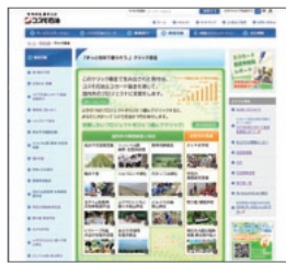
http://www.cosmo-oil.co.jp/kankyo/charity/ ホーム>環境活動>クリック募金

コスモ石油のクリック募金サイトでは、好きなプロジェクトを選んでクリックすると、クリックの数だけコスモ石油がエコカード基金に寄付します(クリックは1人1日1回まで)。2011年度は6,344,057回(=円)のクリックがありました。