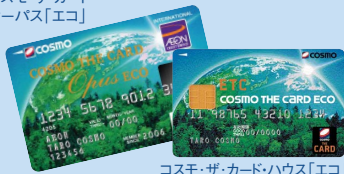
コスモ・ザ・カード・ハウス「エコ」

コスモ・ザ・カード・オーパス「エコ」、コスモ・ザ・カード・ハウス「エコ」は、「地球のために何かしたい」という思いを実現するための、どなたでも参加できるカードです。